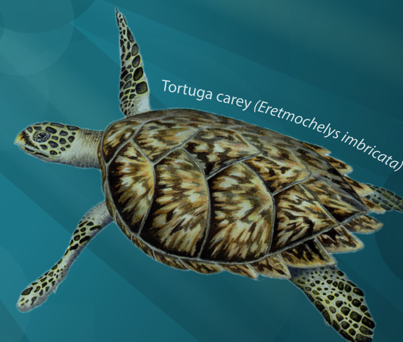
Tortuga Carey ( Eretmochelys imbricata )