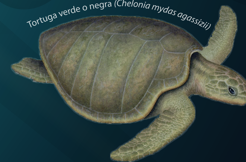
Tortuga verde o negra ( Chelonia mydas agassizii )