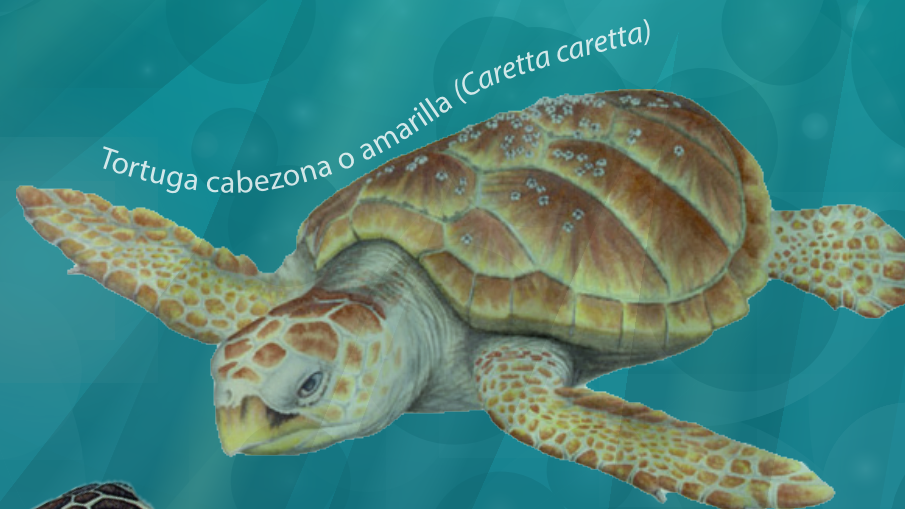
Tortuga cabezona o amarilla ( Caretta caretta )