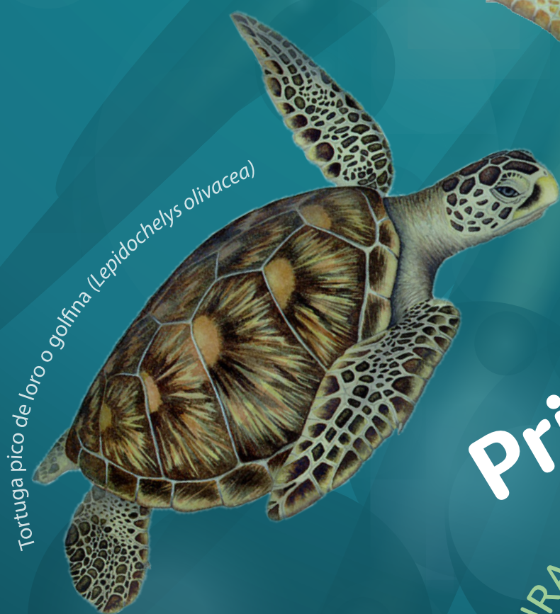
Tortuga pico de loro o golfinia ( Lepidochelys olivacea )