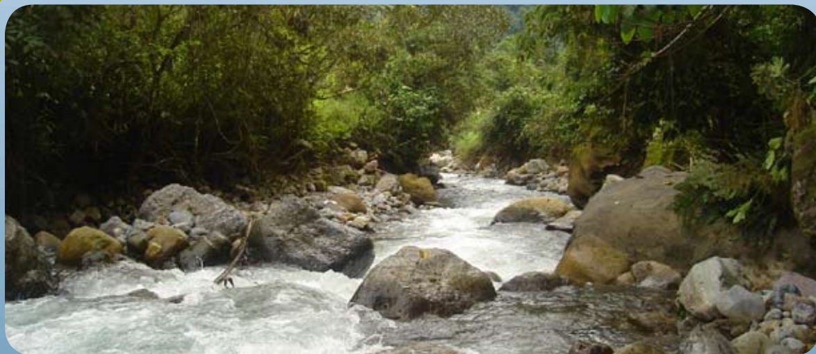
Microcuenca Rumiyacu-Mishqiyacu en el Alto Mayo, San Martín.

En la región San Martín, la provisión de agua en cantidad y calidad necesarias para el consumo humano, así como para el uso agrícola e industrial se está convirtiendo en un problema cada vez más grave. Este es causado principalmente por la pérdida del bosque, inclusive en las áreas de conservación, lo que reduce la cantidad disponible de agua en época de estiaje y afecta la calidad del agua por el aumento de la carga de sedimentos en los ríos. Además, las actividades agropecuarias contaminan los ríos con aguas servidas derivadas del procesamiento del café, residuos fecales provenientes de la ganadería y ausencia de servicios higiénicos, así como la presencia de agroquímicos,