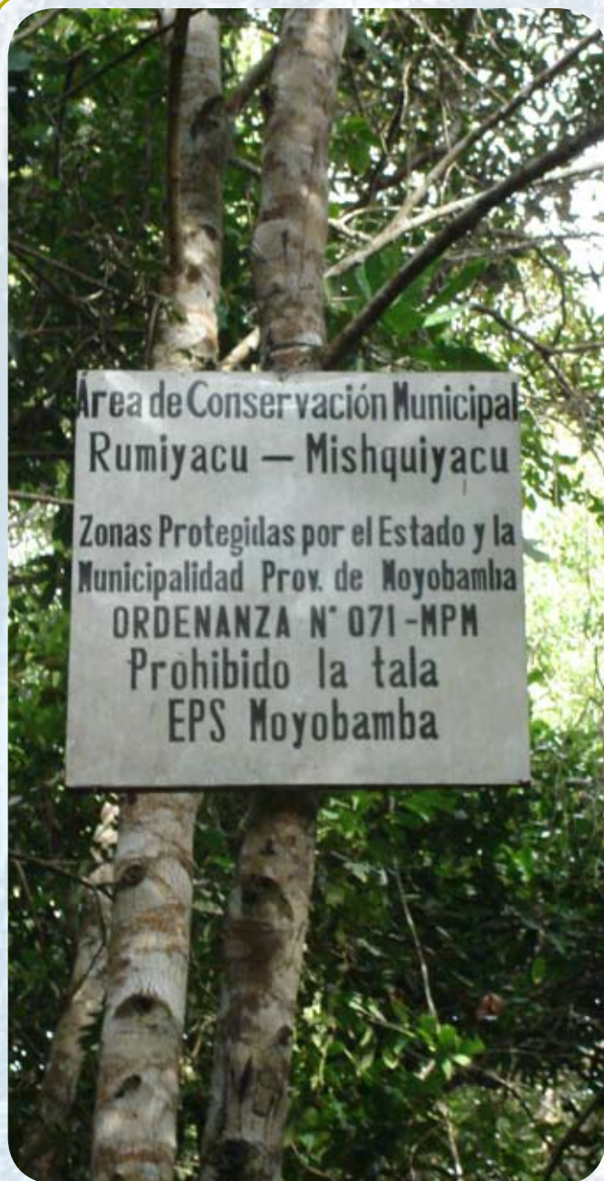
Área de Conservación Municipal Rumiyacu-Mishqiyacu.

aplicados sobre todo en el cultivo de arroz. Simultáneamente existe un aumento en la demanda de agua debido al crecimiento poblacional, causado en gran parte por la inmigración incontrolada.