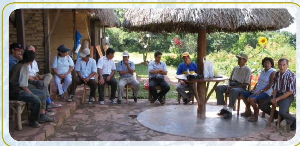
Discutiendo el esquema entre algunos miembros del Comité Gestor.

Cooperación internacional: Está apoyando en la creación de capacidades locales con el propósito de realizar diagnósticos y diseñar estrategias para el uso sostenible de los recursos naturales y en la implementación de estas estrategias, por ejemplo el modelo propuesto. Además, facilita y acompaña los procesos de coordinación y concertación de las estrategias entre los diferentes actores y apoya al establecimiento de contactos institucionales a nivel nacional e internacional entre sector público y privado.