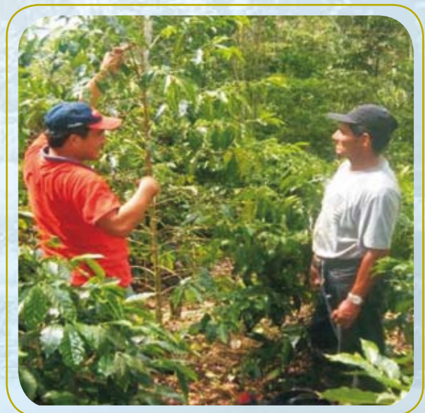
Productores evaluando los avances en los sistemas agroforestales

Comité técnico: Es la entidad que se encarga de la operatividad del esquema de CSE a partir de las funciones delegadas por el Comité Gestor. Entre sus funciones se encuentra el dar el visto bueno a la solicitud de créditos y otorga el derecho a cada miembro inscrito a recibir compensaciones por cumplir las obligaciones establecidas en los contratos CSE.