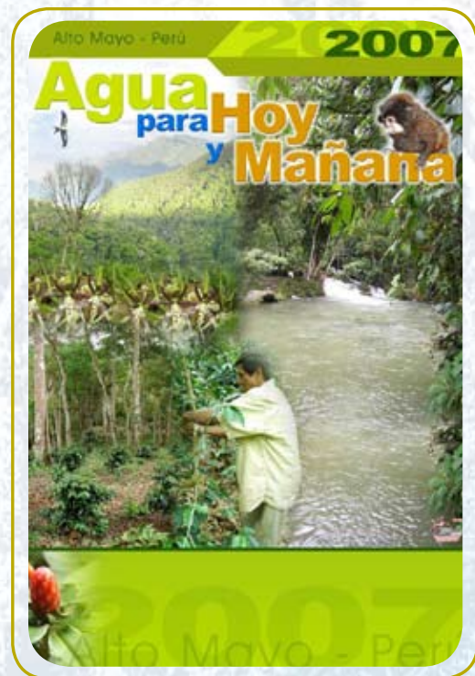
Afiche de comunicación.

“Si seguimos con la tala indiscriminada y la destrucción de nuestros bosques, y con ellos la disminución acelerada del agua y la pérdida de suelos por erosión, tendremos pronto que volver a migrar y seguir en la pobreza. El problema es si tendremos todavía a donde ir, pues por todas partes esta ocurriendo lo mismo”.