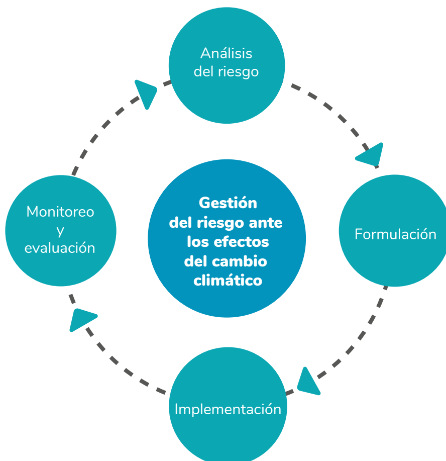
Modelo conceptual de la gestión del riesgo ante los efectos del cambio climático

De este modo, como se visualiza en el siguiente gráfico, la adaptación al cambio climático en el Perú incorporará en la actualización de las NDC un modelo de gestión de riesgos que permita identificar oportunamente zonas del país que presentan niveles altos y muy altos de riesgo ante los efectos de los peligros asociados al cambio climático. Gracias a ello la intervención sobre el territorio será mejor planificada, priorizando a los sujetos más vulnerables y expuestos, particularmente en el actual contexto del COVID-19.