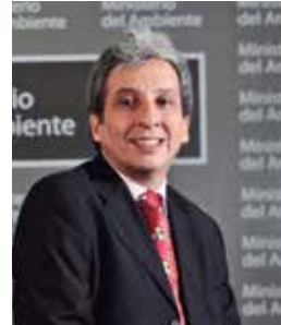
Manuel Pulgar-Vidal Otálora Ministro del Ambiente