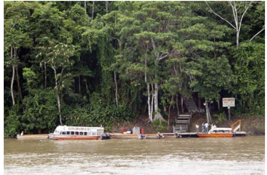
La iniciativa REDD, que beneficiaría económicamente la deforestación evitada, también ha sido explicada en talleres regionales.

A la par, la iniciativa de Reducción de Emisiones de Carbono causadas por la Deforestación y la Degradación de los Bosques (REDD) también está en carpeta. “El MINAM ha invitado a la CONAP y Aidesep a participar en talleres en Tarpoto, Cusco, Loreto, entre otras regio-