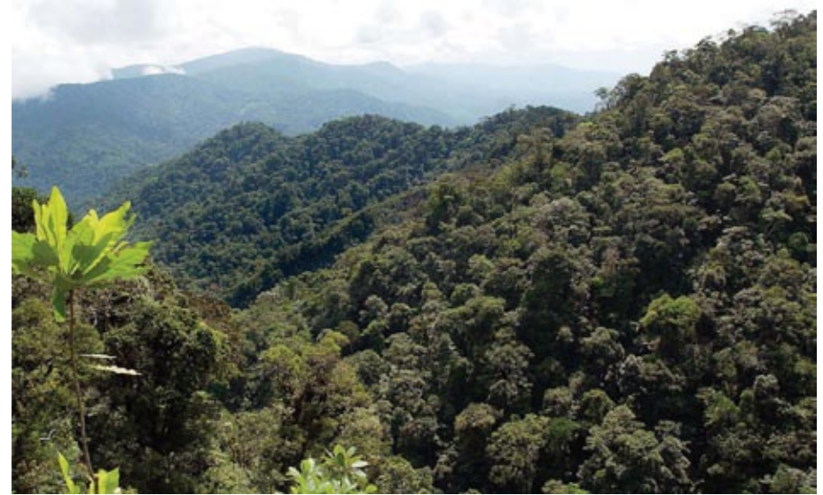
Secos o tropicales, los 19 millones de hectáreas de las Áreas Naturales Protegidas aglomeran más de 16 millones de ha de bosques.