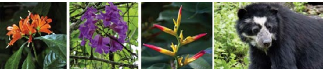
Variada biodiversidad de flora y fauna, a donde se incluye al simbólico oso de anteojos, es vida beneficiada con la conservación de bosques

Ante ello, y a la sombra del cambio climático que puede llegar a superar los 2º C de temperatura a fin de siglo –límite que se ha propuesto la comunidad internacional–, proteger 54 millones de ha de nuestros bosques es “dejar de emitir gases de efecto invernadero y retener en la