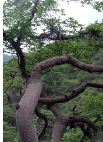
Pasallo (eriotheca Ruizi), árbol típico de los bosques secos en la costa norte del Perú