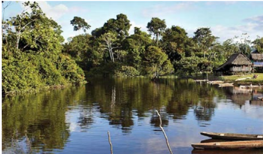
Las comunidades nativas podrán participar activamente en preservación con el Programa Nacional de Conservación de Bosques

A la par, 17'971,768 hectáreas más, según el Ministerio de Agricultura, vendrán de los bosques de producción; destinados solamente para el manejo forestal. “Ya tenemos concesionadas 8'474,876 hectáreas con fines maderables y para otros productos del bosque (castaña y siringa)”, apunta Brack Egg. A su vez, los bosques secos del norte sumarán 2'252,492 hectáreas más a la iniciati-