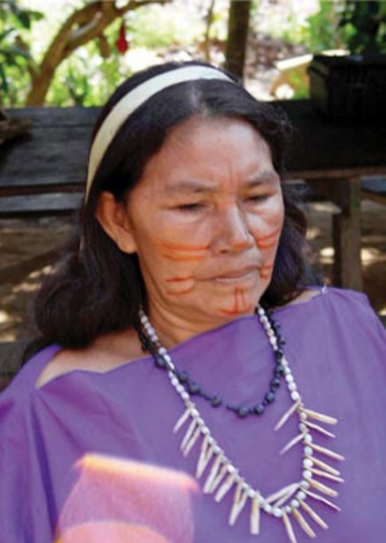
Las comunidades nativas tienen un rol fundamental en el Programa Nacional de Conservación de Bosques.

que apunta a otorgar un incentivo económico a las comunidades nativas tituladas que asciende a 10 soles por hectárea de bosque conservada.