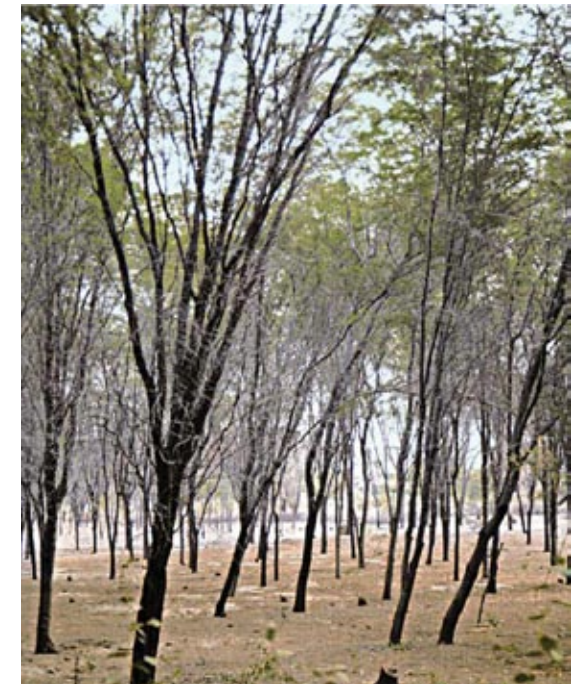
Conservación sin distinción de diámetro.

Pero además, es conservar la biodiversidad, el agua de las cuencas, el hábitat de los pueblos indígenas y los múltiples servicios ambientales que los bosques secos y tropicales brindan. “El objetivo para el año 2021 es llevar la deforestación neta a cero, con lo que habremos reducido nuestras emisiones de gases de efecto invernadero en 47.5%”, destaca el Ministro Brack. Frente a la meta de la Unión Europea, que es una de reducción de 20%, la cifra es amplia. Y se logrará tan solo respetando los bosques amazónicos.