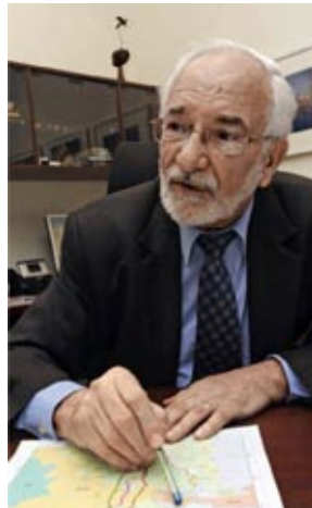
“Hemos aumentado guardaparques a 600”.

El Programa Nacional de Conservación de Bosques incluye, además, 10'653,709 ha de las tierras tituladas a las comunidades nativas, que serán conservadas también a través de la intervención de Conservación