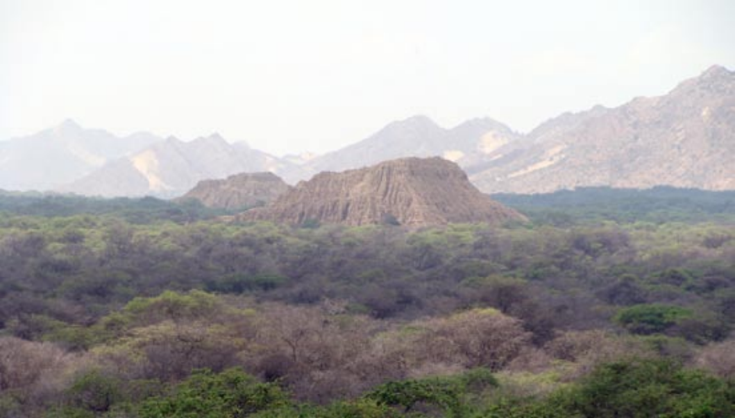
Extensión de algarrobales en la costa norte. Los bosques secos representan 3 millones de hectáreas en el compromiso de conservación.