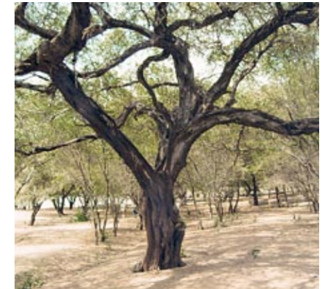
Entererza de algarrobal en la costa norte

Ahora bien, una cosa es el planteamiento, otra la acción. Para ella, poderoso caballero es Don Dinero, con lo cual el financiamiento resulta primordial. Lo positivo: “Ya estamos encaminados —indica el ministro—. Alemania se ha comprometido a aportar para los próximos 5 años