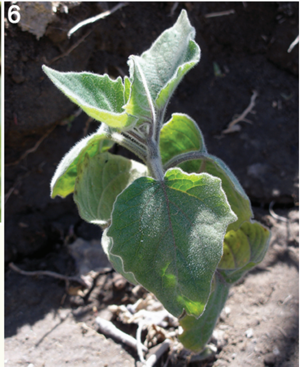
1, 2) Flores de Physalis peruviana ; 3) Fruto; 4) Fruto; 5) Hoja; 6) Plántula.