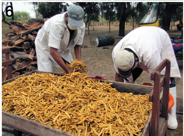
1) Bosque de Prosopis pallida ; 2) Hábito; 3) Hojas; 4) Flores; 5) Flores (virado 90°); 6) Cosecha de frutos ("algarroba").